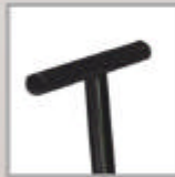
Palanca en "T" para mejor agarre.