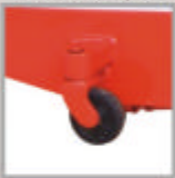
Soporte y horquilla de fundición de acero para mayor durabilidad.