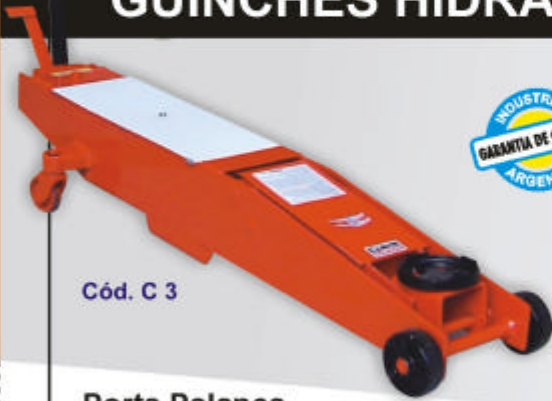
Cód. C 3