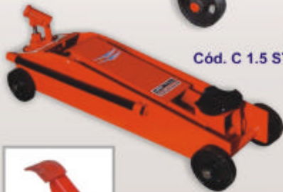
Cód. C 1.5 ST