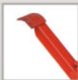
Pedal para bombeo rápido