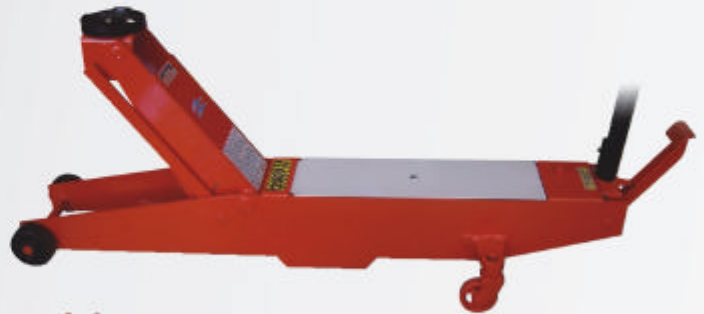
Cód. C 2