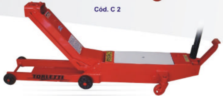
Cód. C 2 Chato